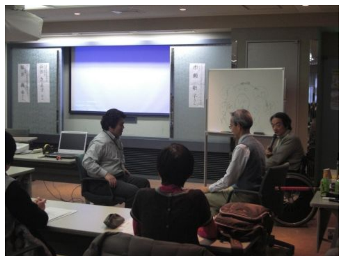
福井先生による体験学習