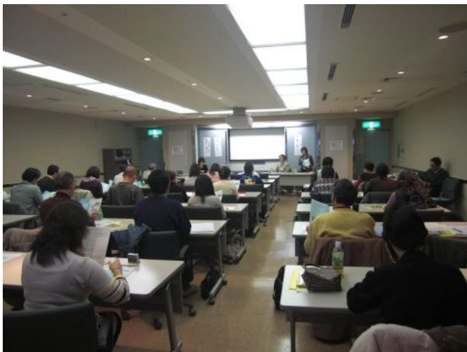
会場には大勢の人が参集した