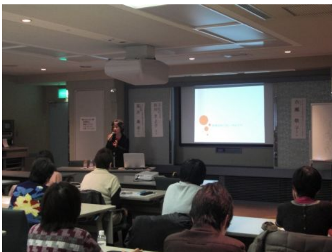
浜田先生の基調講演